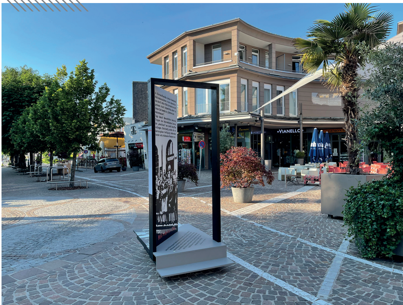
Ausstellungsansicht, Velden am Wörthersee, 2021.

www.villachimfokus.at, 3. Juni 2021 ( https://www.villachimfokus.at/velden-stellt-sich-der-ns-vergangenheit/ )