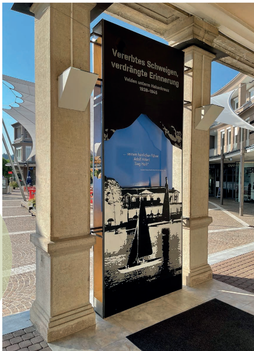
Ausstellungsansicht, Velden am Wörthersee, 2021.