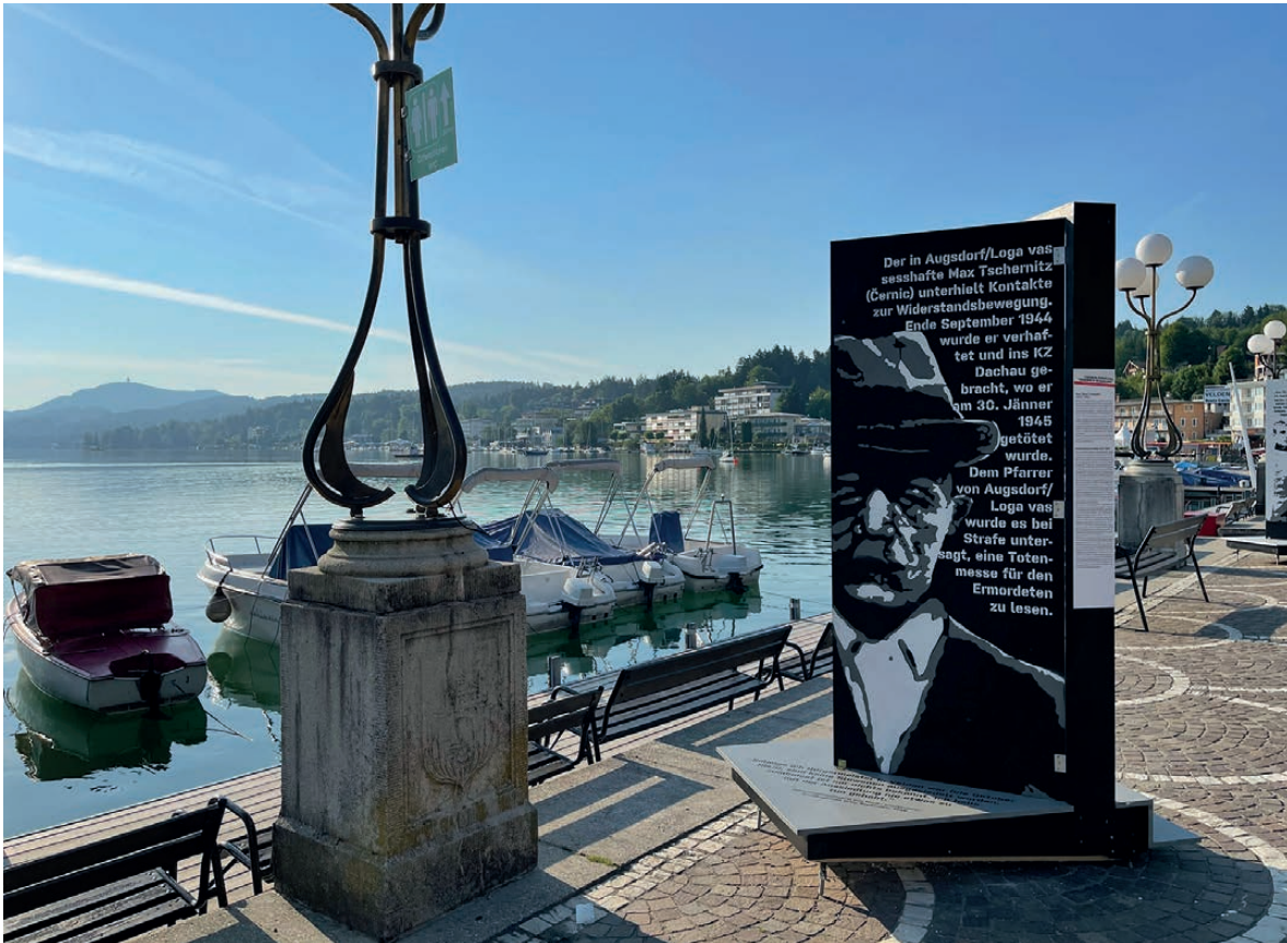
Ausstellungsansicht, Seepromenade, Velden am Wörthersee, 2021.