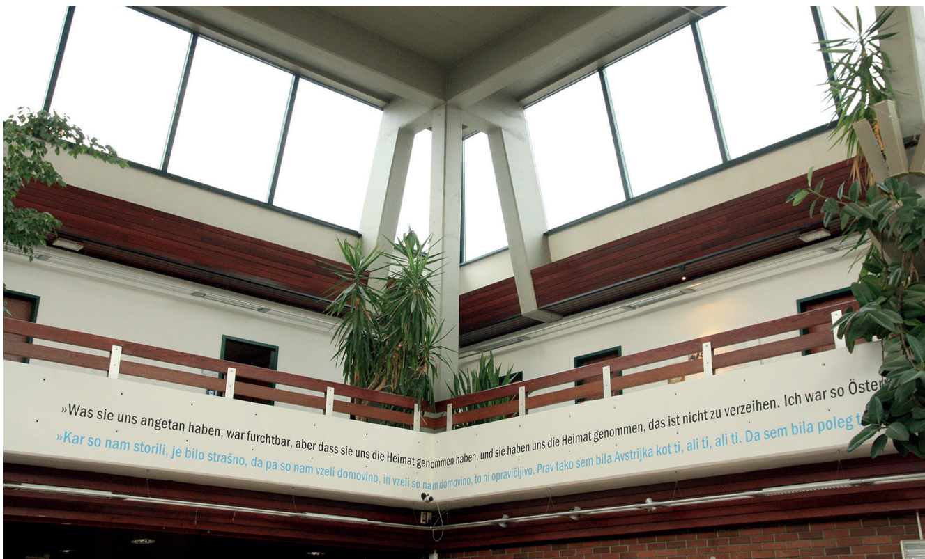
Ausstellungsansicht, Aula, Alpen-Adria-Universität Klagenfurt/Celovec, 22. Oktober 2008. Vom 23. Oktober bis 14. November 2008 war die Ausstellung „Tu smo bili doma/Wir gehörten hierher“ an der Alpen-Adria-Universität Klagenfurt/Celovec zu sehen.

Die Ausstellung „Tu smo bili doma/Wir gehörten hierher“ wurde in Zusammenarbeit des Universitätskulturzentrums (UNIKUM) und dem Slowenischen Kulturverein Zarja an der Alpen-Adria-Universität Klagenfurt/Celovec gezeigt.