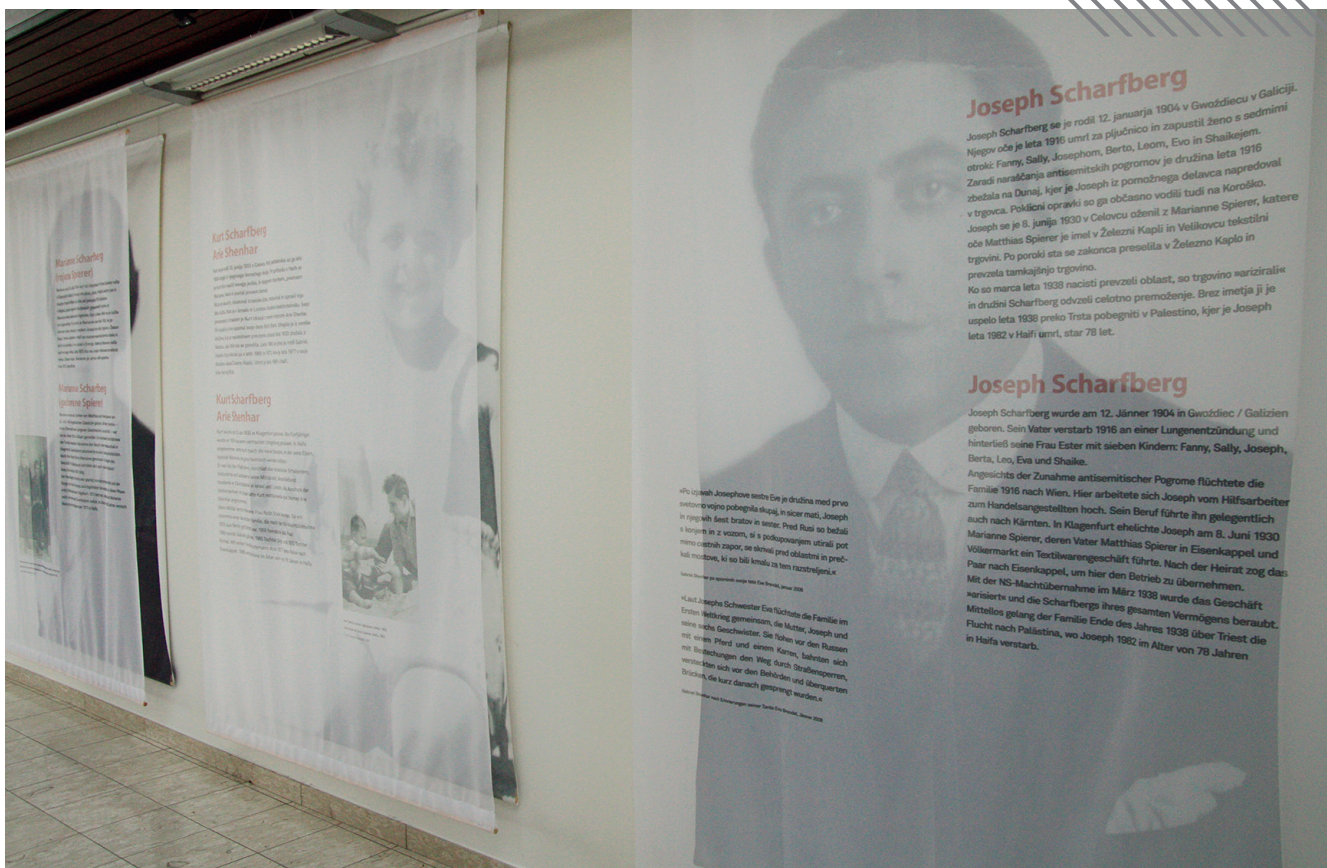
Ausstellungsansicht, Aula, Alpen-Adria-Universität Klagenfurt/Celovec, 22. Oktober 2008.

Die Ausstellung „Tu smo bili doma/Wir gehörten hierher“ wurde in Zusammenarbeit des Universitätskulturzentrums (UNIKUM) und dem Slowenischen Kulturverein Zarja an der Alpen-Adria-Universität Klagenfurt/Celovec gezeigt.