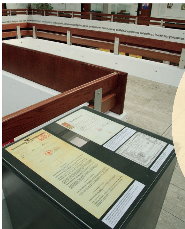
Ausstellungsansichten, Aula, Alpen-Adria-Universität Klagenfurt/Celovec, 22. Oktober 2008.

„Was sie uns angetan haben, war furchtbar, aber das sie uns die Heimat genommen haben, ... und sie haben uns die Heimat genommen, das ist nicht zu verzeihen. Ich war so Österreicherin like you, or you, or you, ... dass ich Jüdin daneben war, okay, das war meine Religion. I am right, aber wir gehörten hierher, ... und mit Recht! Ich bin dort geboren, ich habe das Land geliebt, es war genauso meine Heimat, wie es die Heimat von jemand anderen ist. Die Heimat genommen, Leben ist aus, finito. Dass man weiterlebt, das ist schrecklich. Ich habe dasselbe Recht zu Klagenfurt gehabt, wie everybody else. Ich habe es geliebt, so wie jeder andere, es war meine Heimat.“